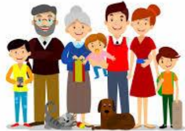
Imagen No. 1

Recuerde conservar las anteriores actividades resueltas dentro de su portafolio de evidencias y esté atento a la retroalimentación de su instructor a las actividades antes planteadas.